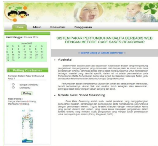
Gambar 2. Halaman Utama

Halaman Utama adalah tampilan awal dalam website sistem pakar. Cara untuk mengakses halaman ini adalah http://localhost/SP/