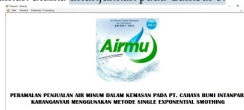
Gambar 5. Halaman utama

Tampilan halaman utama ditunjukkan pada Gambar 5.