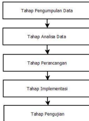
Gambar 1. Alur Pelaksanaan Penelitian