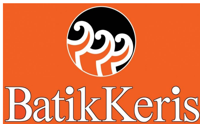
Gambar 4.3 Logo PT Batik Keris