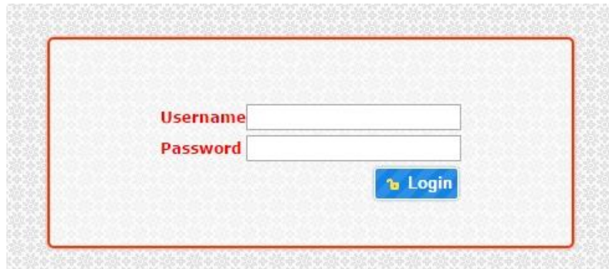
Gambar 4.10 Perancangan Desain Tampilan Login