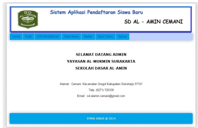
Gambar 4.11 Halaman Utama Admin

Pada halaman admin ini terdapat menu yang berisi Beranda dan Master. Admin bertugas melindungi system dan mengatur hak akses masing-masing bagian. Adapun desain halamannya adalah: