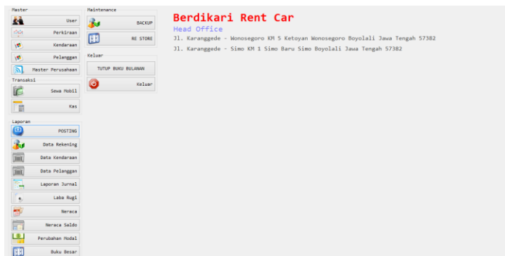
Gambar 4.20. Tampilan menu utama

Jika berhasil login, maka kita masuk menu utama