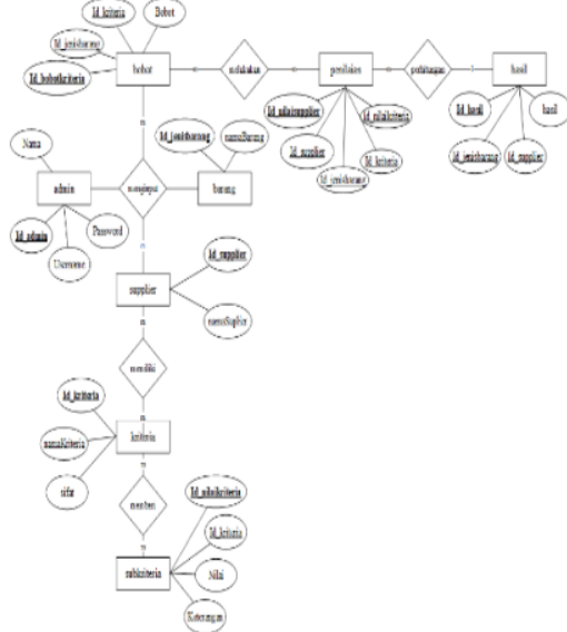
Gambar 3. Entity Relationship Diagram

ERD merupakan diagram yang digunakan untuk merancang suatu database dan menunjukkan relasi antar objek atau entitas beserta atributnya yang dapat dilihat pada Gambar 3 berikut.