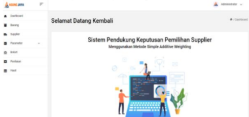
Gambar 6. Halaman Dashboard

b) Halaman Dashboard Halaman dashboard merupakan tampilan saat admin berhasil login, halaman dashboard ini menampilkan semua fitur yang ada dalam aplikasi, ditunjukkan pada gambar 6 berikut.