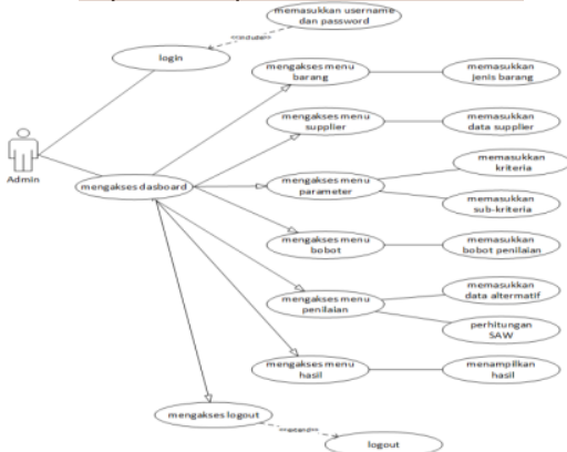
Gambar 1. Use Case Diagram

Use Case diagram merupakan salah satu jenis dari diagram UML (Unified Modelling Language) dimana use case diagram menggambarkan hubungan interaksi antara actor dengan sistem. Adapun use case yang dibuat yaitu: Use Case Actor, Login, Barang Supplier, Kriteria, Sub Kriteria, Bobot Penilaian, hal ini dapat dilihat pada Gambar 1 berikut.