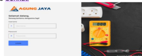
Gambar 5. Tampilan Login

Halaman ini merupakan tampilan awal saat admin menggunakan aplikasi, admin diharuskan melakukan login dengan mengisi username dan password , ditunjukkan Gambar 5 berikut.