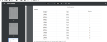
Gambar 8. Halaman Laporan Hasil

d) Laporan Hasil Halaman ini berisikan laporan dalam bentuk PDF yang nantinya dapat didownload dan dilakukan pencetakan, ditunjukkan pada gambar 8 berikut.