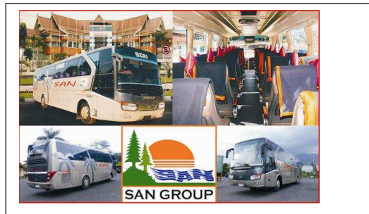
Gambar Armada SAN

SAN (Siliwangi Antar Nusa) merupakan armada bus yang melayani lintas pulau . Pelayanan SAN dari pulau Sumantera ke pulau Jawa dan sebaliknya. Pulau Sumantera diawali dari Pangangkaraya Riau sampai ke pulau Jawa . Layanan di pulau jawa kota yang paling timur dilayani adalah kota Madiun. Jenis layanan bus dibagi 2 kelas Exsekutif dan Busnis.